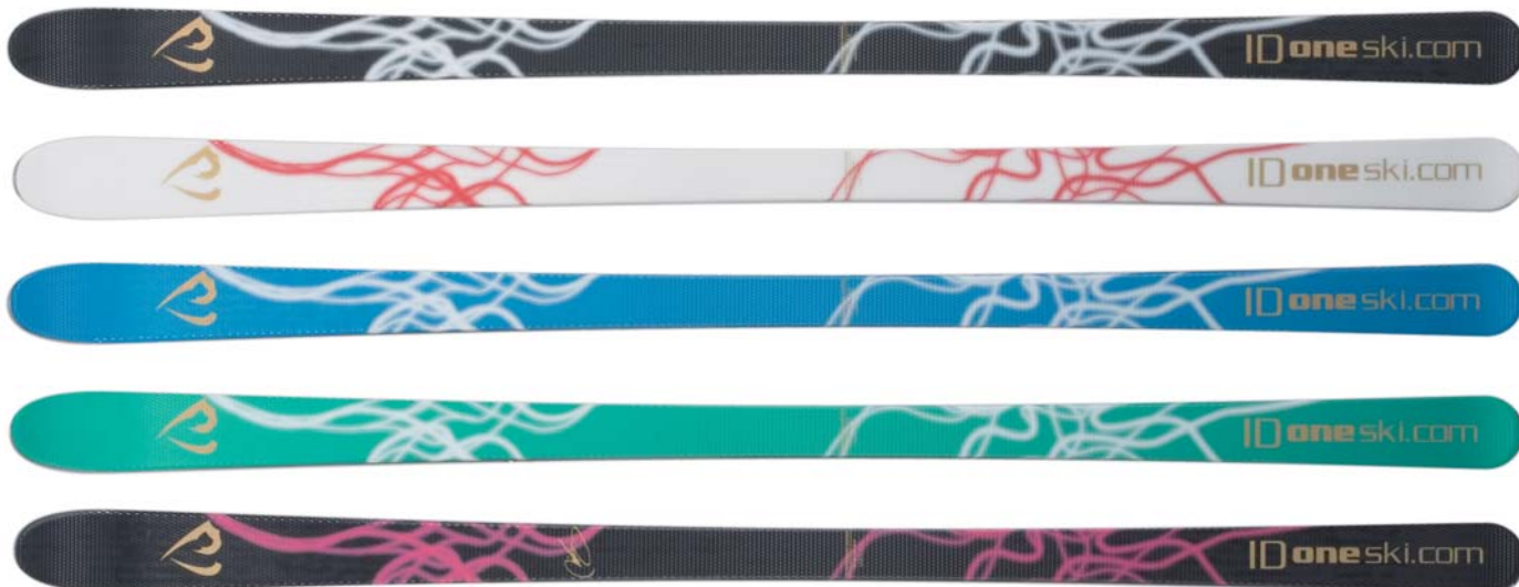
アイコシグネチャー

クラッドエッジ(切れ目のあるエッジ)を採用する事により、エッジ自体の張りが弱くなり、芯材の特性が素直にスキーに反映されます。コブの中でのズレによるコントロールを徹底的に追及しました。コブの中においても板を滑らかにずらすことができ、自然なポジション取りがしやすいモデルです。サイズは172cm・177cmの2サイズをご用意。07/08シーズン上村愛子選手はMR-CE172cmアイコシグネチャーへチェンジし、ワールドカップ5連勝を記録、日本人初の総合優勝という輝かしい成績を勝ち取りました。