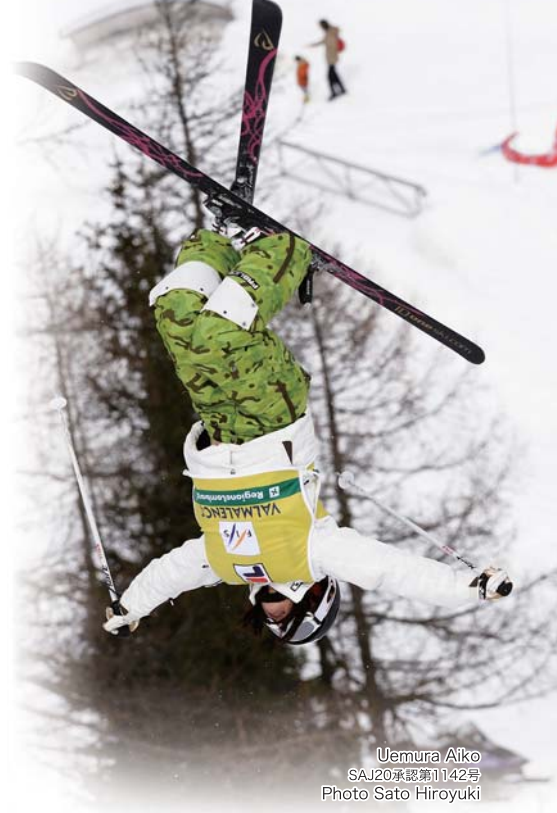
Uemura Aiko SAJ20承認第1142号