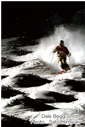
Dale Begg-Smith

G=(Grown-up) 08/09シーズンより新たに展開するNEWモデル。 成長したモーグルスキーヤーのために開発しました。 CSサンドイッチ構造(CS=CAP SEET)を採用し、 板のたわみが感じやすく、更にその効果をより体感しやすくするために、 ステンレスクラッドエッジを使用しています。 サイズは168cm・173cmの2サイズを採用し、 幅広いレベルのモーグルスキーヤーに対応します。 MR-Dからのステップアップモデルとしてもお勧めです。